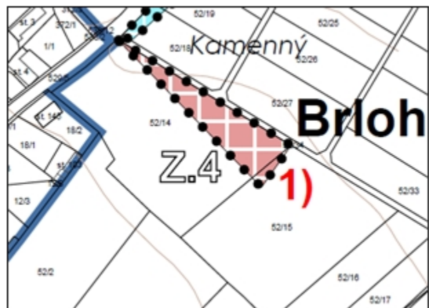
Obrázek 2: Výstřižek z hlavního výkresu schéma změn z návrhu pro opakované veřejné projednání návrhu Změny č. 2 ÚP Brloh

Upravený návrh Změny č. 2 územního plánu Brloh je vystaven k nahlédnutí u pořizovatele – Městský úřad Přelouč, odbor stavební, Československé armády 1665, 535 33 Přelouč, (kancelář II. patro č. dveří 2.22/A).